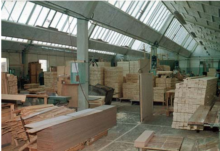
Maskinevej 4 før 2007