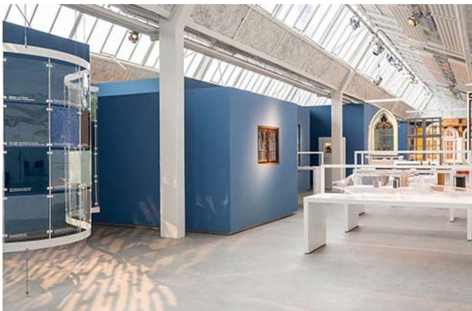
Maskinevej efter vinduesudstillingens åbningen i 2007